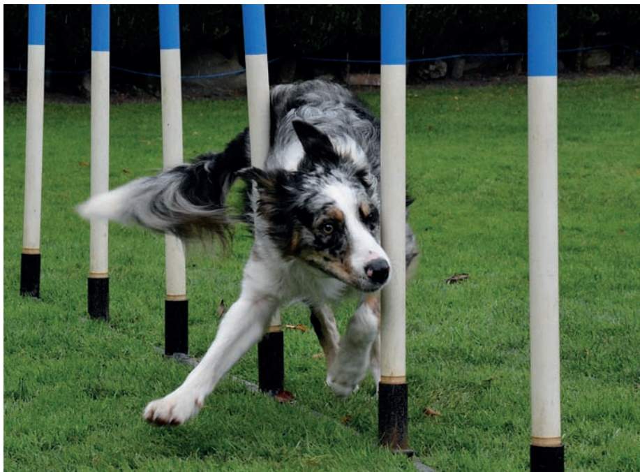
Psi, kteří nejsou extrémně vzrušiví, se snáze soustředí při práci, výcviku nebo soutěžích.

klidně a k tomu, aby se dostali do stavu výrazně vyššího vzrušení nebo úzkosti, je zapotřebí značná vnější stimulace nebo dráždění.