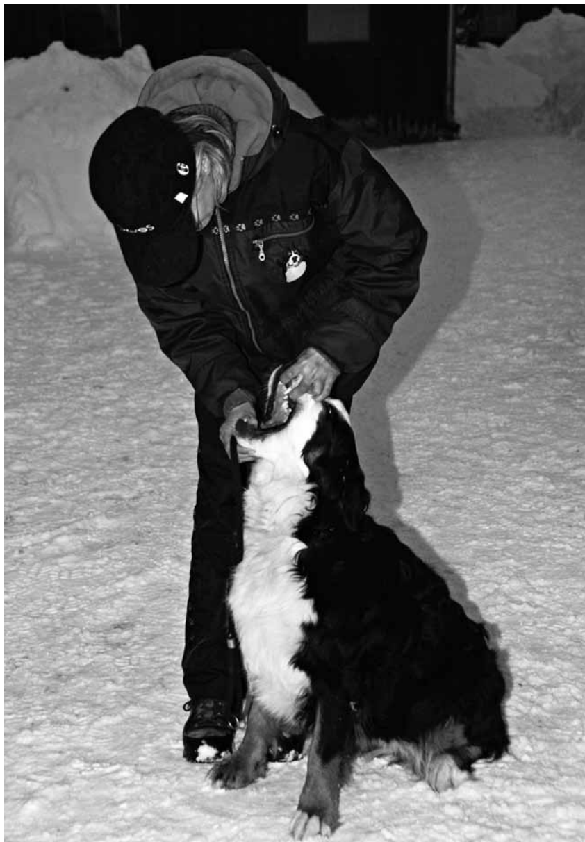
Ukazování zubů bernského salašnického psa.