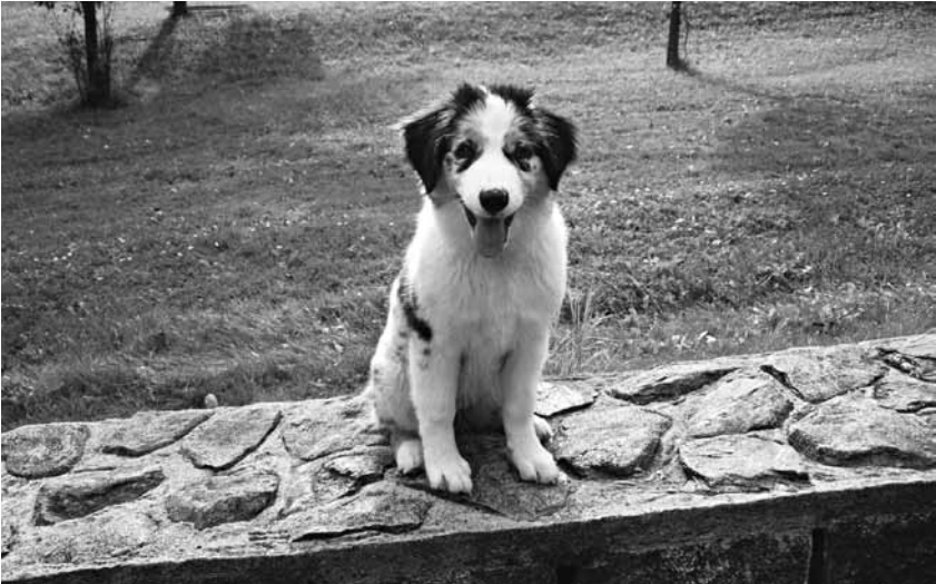
Štěně australského ovčáka.

neznám nikoho, kdo by s tímto plemenem měl dostatek zkušeností. Jaké jsou rozdíly mezi oběma plemeny z hlediska služebního výcviku?