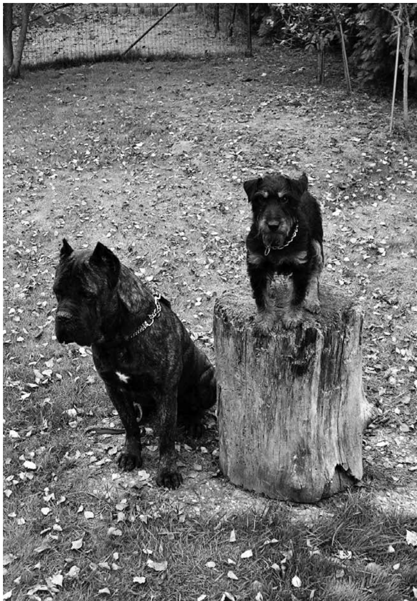
Cane corso nebo jagdteriér? Klidně oba.